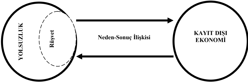
Tablo: 4 Kayıt Dışı Ekonomi, Yolsuzluk ve Rüşvet Arasındaki İlişki

Not: Tablo yazar tarafından oluşturulmuştur.